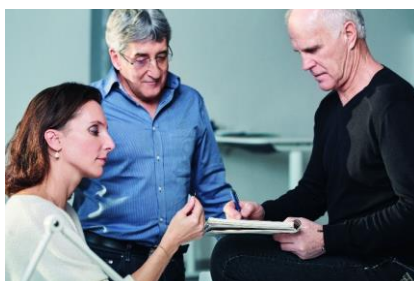
Fig. 6: Passione per l'innovazione grazie alla partnership con i nostri esperti in endodonzia: Partner per un futuro migliore.