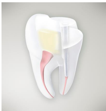
Fig. 5: Grazie alla Soluzione "R2C™", i prodotti endodontici e restaurativi si uniscono tra loro, per una soluzione completa.