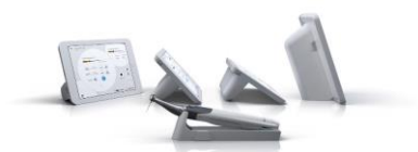
Fig. 1: X-Smart IQ: motore cordless con movimento continuo e reciprocante controllato da un'applicazione Apple iOS.