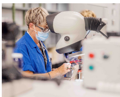
Fig. 5: El centro de producción en Ballaigues ha presentado más de 500 solicitudes de patente.