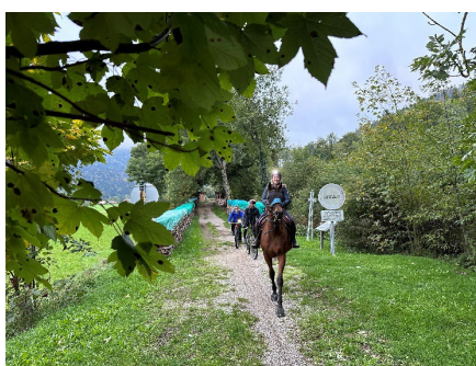
Fig. 6: El reto de movilidad de Dentsply Sirona animó a los empleados a encontrar maneras de desplazarse al trabajo que no emitieran carbono.