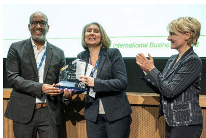
Fig. 1: Dentsply Sirona de Ballaigues recibe el impresionante Vaud International Business Award.